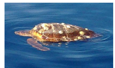
Unter SAFE müssen versehentlich mitgefangene Schildkröten wieder freigelassen werden.