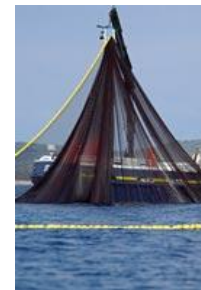
Unter dem Internationalen Kontrollprogramm für delfinsicheren Thunfisch/SAFE dürfen Ringwaden nicht um Delfinschulen gesetzt werden.