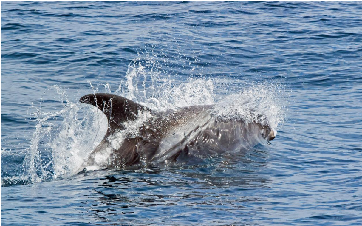
Weißschnauzendelfin vor Neufundland