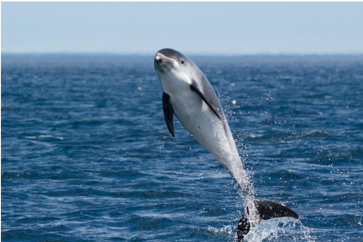
Ein wilder Delfin, der springt weil er will, nicht weil er muss!

Dass die Tiere immer lächeln, wird ihnen gerade in Gefangenschaft zum Verhängnis. Dabei sollte man aber unbedingt wissen: Delfine haben keine Gesichtsmuskeln! Es sieht daher immer nur so aus als würden sie lächeln – auch unter Schmerzen und sogar nach dem Tod!