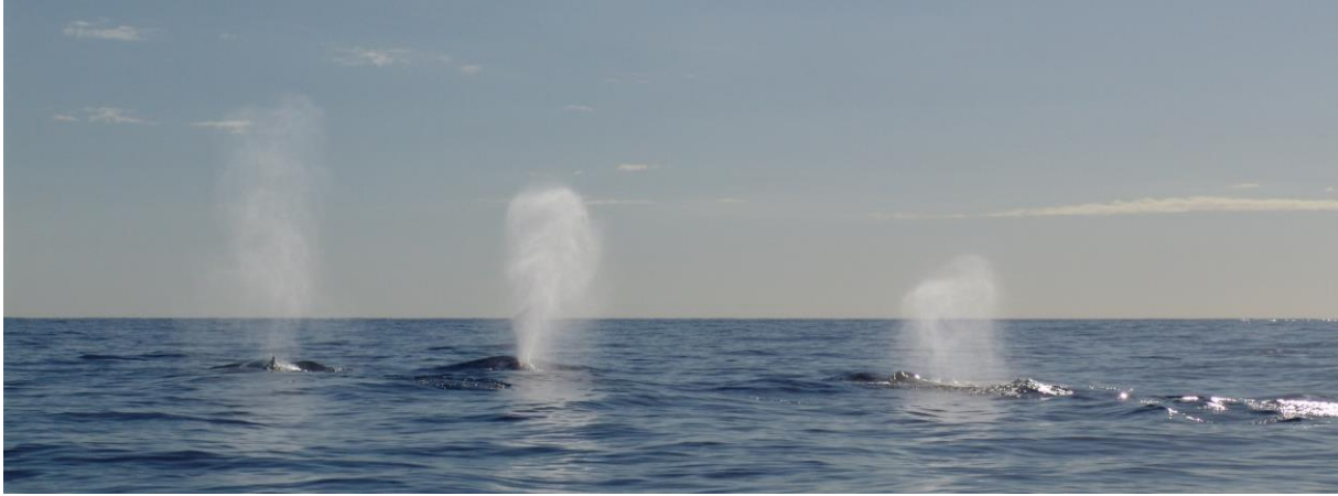
Drei ausatmende Buckelwale, deren Fontäne mit Glück kilometerweit sichtbar ist!

Für Hobbyforscher und Touristen ist es mit ein wenig Übung am einfachsten, die Tiere mit entsprechenden Büchern zu bestimmen, in denen die spezifischen Merkmale aufgeführt sind. Besonders spannend ist es, nach dem sogenannten „Blas“ Ausschau zu halten. Vor allem die größeren Wale stoßen eine jeweils charakteristische Fontäne in die Luft, die durch das Ausatmen entsteht. 9