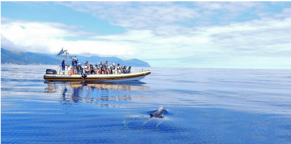
Whale Watching Boot bei der Beobachtung „Gewöhnlicher Delfine“ vor Sao Miguel (Azoren)