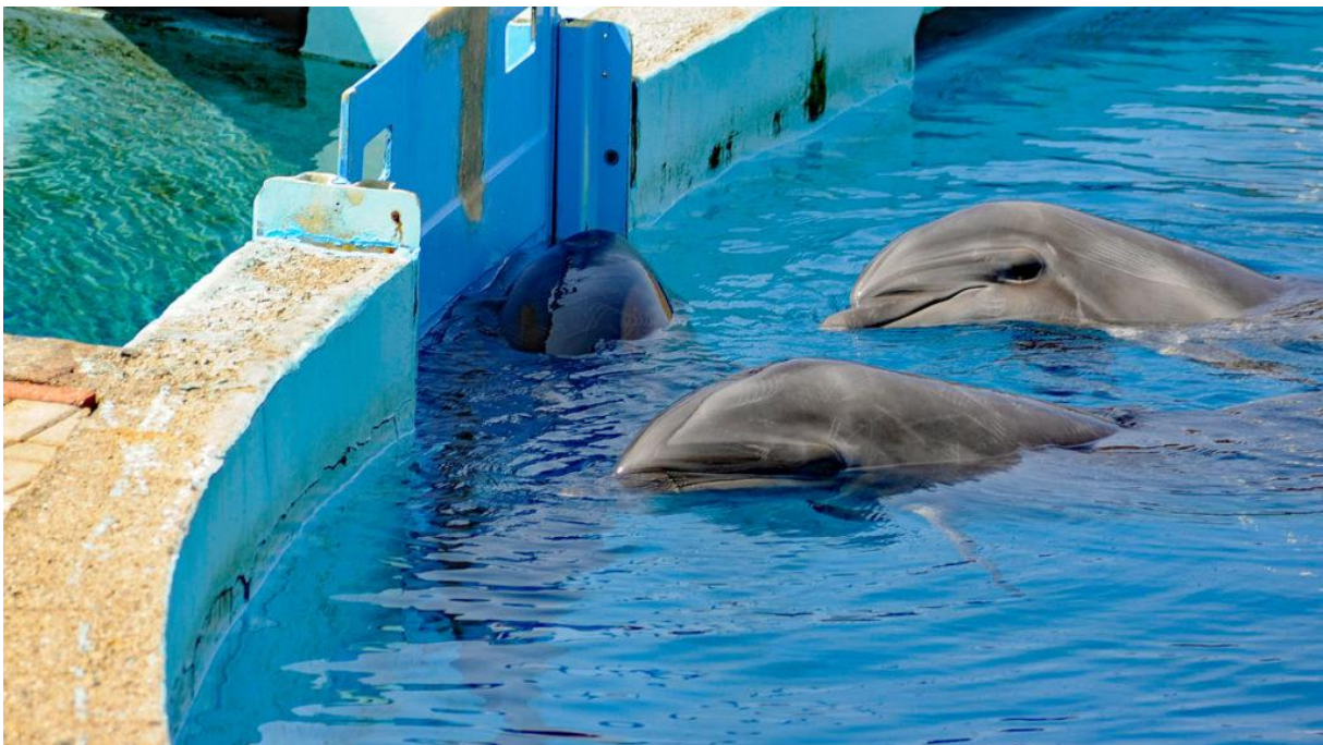
Drei im türkischen Delfinarium Sealanya gefangene Große Tümmeler, Foto: Andrea Steffen

Mit das Schlimmste, was man einem Delfin oder Wal antun kann, ist die Bejahung seiner Gefangenschaft durch den Besuch eines Delfinariums. Diese Form des Whale Watchings ist aufgrund der massiven Auswirkungen auf die Tiere zu verurteilen. Man stelle sich vor: Nach US-Standard betragen die Mindestmaße für ein Becken im Delfinarium 9 m Länge und 1,80 m Tiefe 25 . In Freiheit können Delfine am Tag Strecken von bis zu 100 km zurücklegen und dabei in Tiefen von bis zu 600 m vorstoßen! Die noch deutlich größeren und bis zu 8 m langen Orcas können sogar Tagesetappen von 160 km bewältigen. Weitere Arten, die in Gefangenschaft gehalten werden, sind Belugas und Schweinswale.