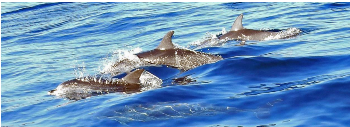
Große Tümmler vor der Insel La Gomera, Foto: A. Diehl

Darunter wird in Anlehnung an die IWC (International Whaling Commission) eine Form des Whale Watching verstanden, welches potentielle Auswirkungen auf die Tiere berücksichtigt und es den Walen und Delfinen ermöglicht, Art und Dauer des Zusammentreffens weitgehend selbst zu bestimmen. 4 Kurz: Den Tieren begegnen und dabei negative Einflüsse minimieren. Für diese Art des Whale Watchings ist es wichtig, sowohl die damit verbundenen Chancen als auch mögliche Risikofaktoren für die Tiere zu kennen. Gerade beim sogenannten „Schwimmen mit Delfinen“ ist es von besonderer Bedeutung, sich möglicher Folgen bewusst zu sein. Wer sich den Tieren sanft und respektvoll nähern will, sollte die Regeln und Verhaltensweisen kennen, die dies überhaupt erst ermöglichen. Dieser Aspekt erscheint vor dem Hintergrund besonders wichtig, weil bis heute international verbindliche Regeln fehlen, an die sich die Veranstalter halten müssen.