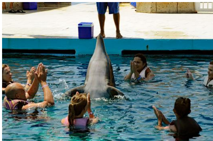
Delfin umringt von Menschen, Foto: Andrea Steffen

In einigen Ländern ist sogar das Schwimmen mit dem größten Vertreter aus der Gruppe der Delfine erlaubt. In Norwegen wird das Schwimmen mit Orcas angeboten, z.T. während diese gerade auf der Jagd sind. 19 Auch mit den richtig großen Vertretern darf man schwimmen. Rund um den Globus gibt es z.B. viele Anbieter, die das Schwimmen mit den bis zu 16 m langen Buckelwalen ermöglichen.