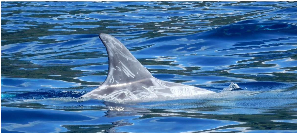
Auf dem Bild: Rundkopfdelfin mit Narben, Pico (Azoren), Foto: A. Diehl

Absolut sinnvoll ist die Verbindung von Whale Watching und Forschung. Damit ist gemeint, dass die entsprechenden Veranstalter nicht nur reine Delfin- bzw. Waltouren betreiben, sondern einen Beitrag zum Schutz der Meeressäuger leisten, indem sie mit anderen Organisationen (Stiftungen, Meeresschutzvereinen, Universitäten etc.) kooperieren. Auch hier kann La Gomera als exemplarisches Beispiel dienen. Zusammen mit dem Projektpartner M.E.E.R. e.V. setzt sich die Gesellschaft zur Rettung der Delphine für die Erarbeitung von Schutzkonzepten für die Meeressäuger in den Gewässern vor La Gomera ein. Ein weiteres Ziel besteht darin, den Einfluss der Menschen auf die Meeressäuger zu untersuchen und daran anknüpfend Regeln für nachhaltiges Whale Watching zu etablieren. 8 Der Whale Watching Veranstalter OCEANO liefert dabei wertvolle Sichtungsdaten über die Meeressäuger, welche den Wissenschaftlern von M.E.E.R. e.V. wiederum als Grundlage für wissenschaftliche Publikationen dienen. So können beispielsweise Aussagen über die Entwicklung unterschiedlicher Delfin- und Walpopulationen gemacht werden.