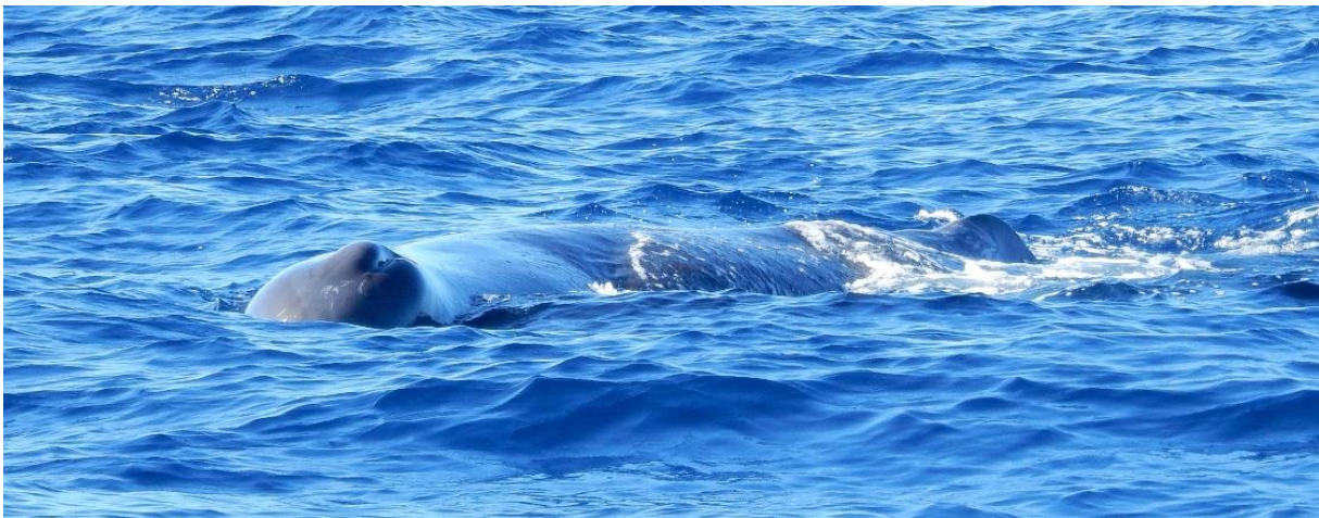
Ruhender Pottwal vor Sao Miguel (Azoren)

Nahrungssuche nicht mehr abstimmen und nehmen dadurch weniger Nahrung zu sich. Auch die rechtzeitige Warnung vor Feinden wird möglicherweise beeinflusst. Auswirkungen sind ebenso bei Großwalen zu beobachten. Ob es Buckelwale sind, die laut einer Studie bei der Annäherung eines Schiffes aufhören zu singen (und damit zu kommunizieren) oder Pottwale, die beeinflusst durch den Schiffsverkehr ihr Tauchverhalten ändern. Gerade bei den Pottwalen, die neben einigen Schnabelwalarten zu den Meistern des Tieftauchens mit entsprechenden Tauchzeiten von bis zu 60 Minuten gehören, kann ein beispielsweise zu frühes Abtauchen aufgrund einer Störung zur Folge haben, dass nicht genug Sauerstoff aufgenommen wurde und damit der nächste Beutezug in Tiefen bis zu 2000 m nicht erfolgreich verläuft. Dies kostet dem Tier energetisch viel Kraft. Zusätzlich besteht die Gefahr, dass große und schnelle Boote die eher langsamen Tiere rammen, wenn sie reglos senkrecht unter der Wasseroberfläche ruhen, um neue Kräfte für den nächsten Tauchgang zu sammeln.