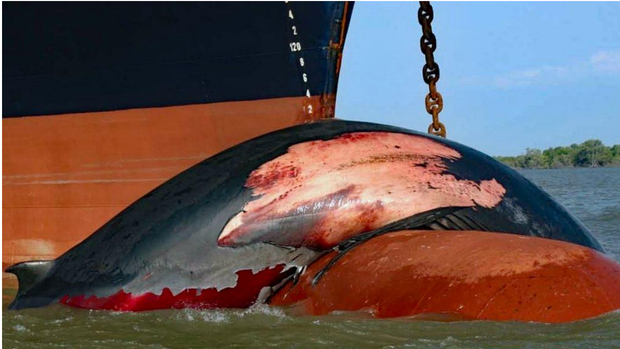
Ein toter Bryde-Wal auf dem Bug eines Containerschiffes, Foto: F. Felix

Allein diese Tatsache, auf die die Organisation M.E.E.R. e.V. gemeinsam mit der Deutschen Umwelthilfe und der GRD schon im Jahr 2003 hingewiesen haben, zeigt die Notwendigkeit eines verantwortlichen und nachhaltigen Whale Watching Tourismus.