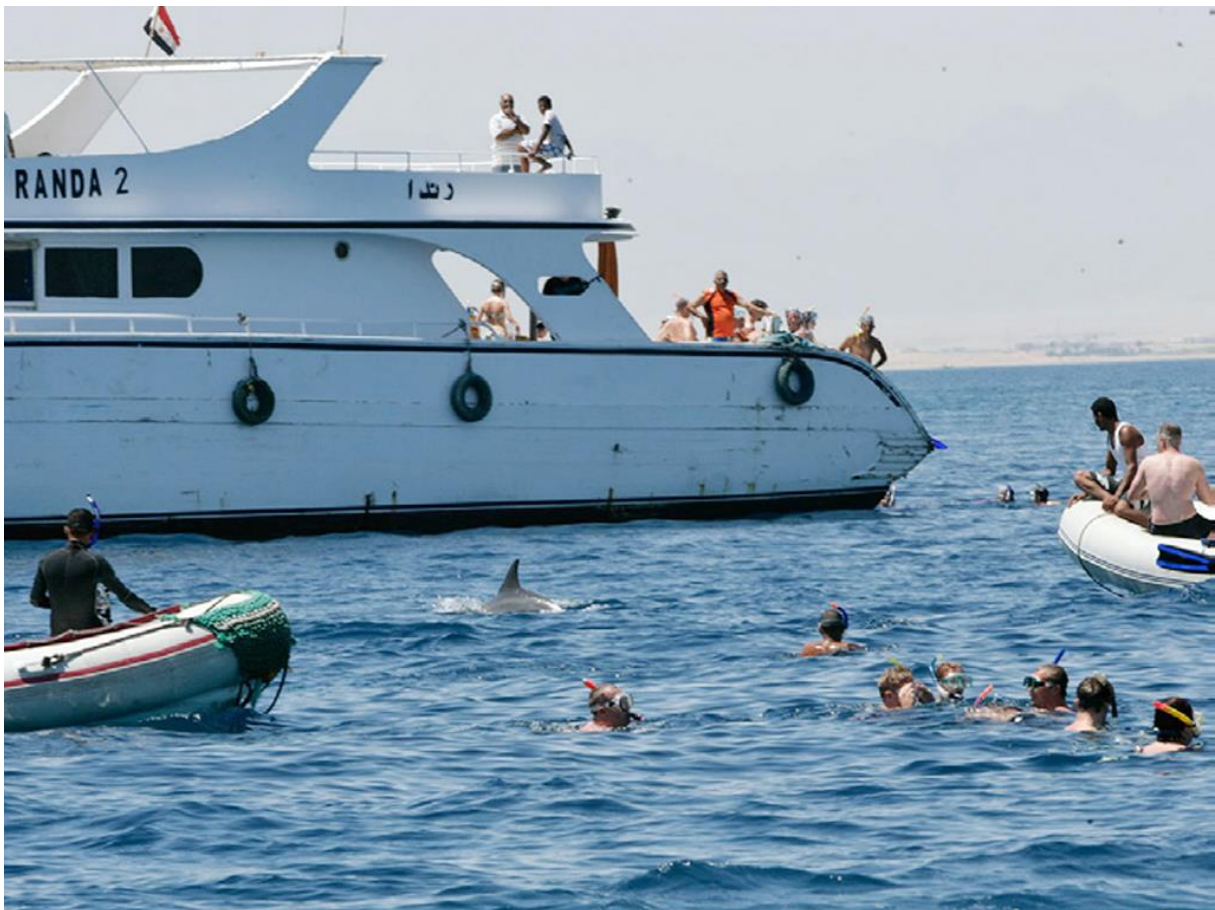
Delfin in Bedrängnis

So unterstützt die GRD beispielsweise das „Schutzprojekt Rotes Meer“ von Dolphin Watch Alliance, welches die negativen Folgen des Massentourismus in Ägypten für die Delfine begrenzen soll. 16 Hier liegt ein absolutes Negativbeispiel vor, welches leider nur stellvertretend für viele andere Regionen auf der Erde steht. Viel zu viele Anbieter betreiben regelrecht Jagd auf die Delfine, welche oft von mehreren Booten, teilweise über 40 bei einer Gruppe, gleichzeitig eingekreist werden.