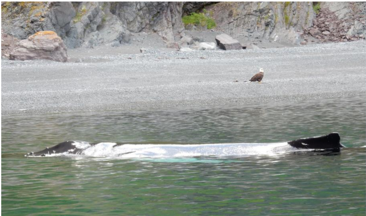
Ein Buckelwal direkt am Strand von Neufundland

ihrer Beute, in Form von kleinen Fischen, bis an die Strände. Während der „Wal- und Delfinsaison“ hat man mit etwas Glück und ein wenig Geduld von fast jeder Stelle an der Küste die Chance, die Meeressäuger zu entdecken.