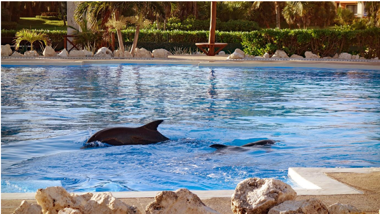
Große Tümmler, gefangen im Hotelpool (4 m tief, 20 m „lang“), Foto: Geraldine S.

Die Erfahrungen und Beispiele zeigen: Als Tourist darf man sich nicht darauf verlassen, dass alle Anbieter, die den Menschen eine Begegnung mit den Delfinen und Walen ermöglichen, auch im Interesse der Meeressäuger handeln. Dies gilt natürlich für die Anbieter von Bootstouren, aber auch für die Betreiber von Delfinarien und Reiseveranstaltern, die bestimmte Angebote zum Whale Watching oder Schwimmen mit Delfinen im Programm haben. Der wohlverdiente Hotelurlaub ist schnell gebucht. Vor Ort stellt man als Freund der Meeressäuger dann vielleicht fest, dass man ein Hotel gebucht hat, welches Delfine im Hotelpool gefangen hält. 42