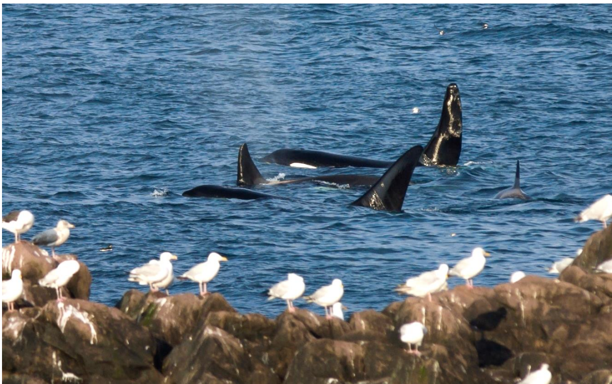
Eine Gruppe Orcas von Land aus beobachtet, Foto: S. Meurs

Bei der Beobachtung von Land aus entstehen für die Tiere keinerlei negative Einflüsse. Weltweit gibt es dafür ausgezeichnete Plätze. So kann man sich beispielsweise auf den Azoren auf die Spuren der ehemaligen Walfänger begeben. Rund um die Inseln stehen noch die sogenannten „Vigia“, das sind Aussichtsplätze in exponierten Lagen, von denen die Walfänger früher die Wale gesucht haben. Je nach Saison lassen sich von dort hauptsächlich Delfine, Pottwale aber auch andere Walarten beobachten. Auch Großbritannien und Irland bieten zum Teil ausgezeichnete Möglichkeiten, Große Tümmler, Orcas, Minkwale etc. direkt vor der Küste anzutreffen. 22 Und selbst in Deutschland hat man z.B. in Wilhelmshaven oder Sylt zu bestimmten Jahreszeiten die Chance, den kleinen Schweinswal vom Ufer aus zu sehen.