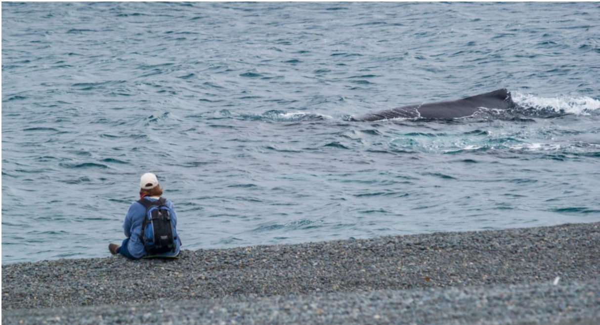
Hier sind keine Regeln notwendig! Kein Boot, keine Störung für die Tiere und ganz nah am Wal.

Wie geschildert verlief die Entwicklung des Wirtschaftszweiges „Whale Watching“ in den letzten Jahrzehnten sehr schnell. Dabei stellte sich die berechtigte Frage, ob man den Tieren, die man ja eigentlich schützen will, nicht mehr schadet als hilft. Die Erkenntnis wuchs, dass es ohne Regulierung nicht geht.