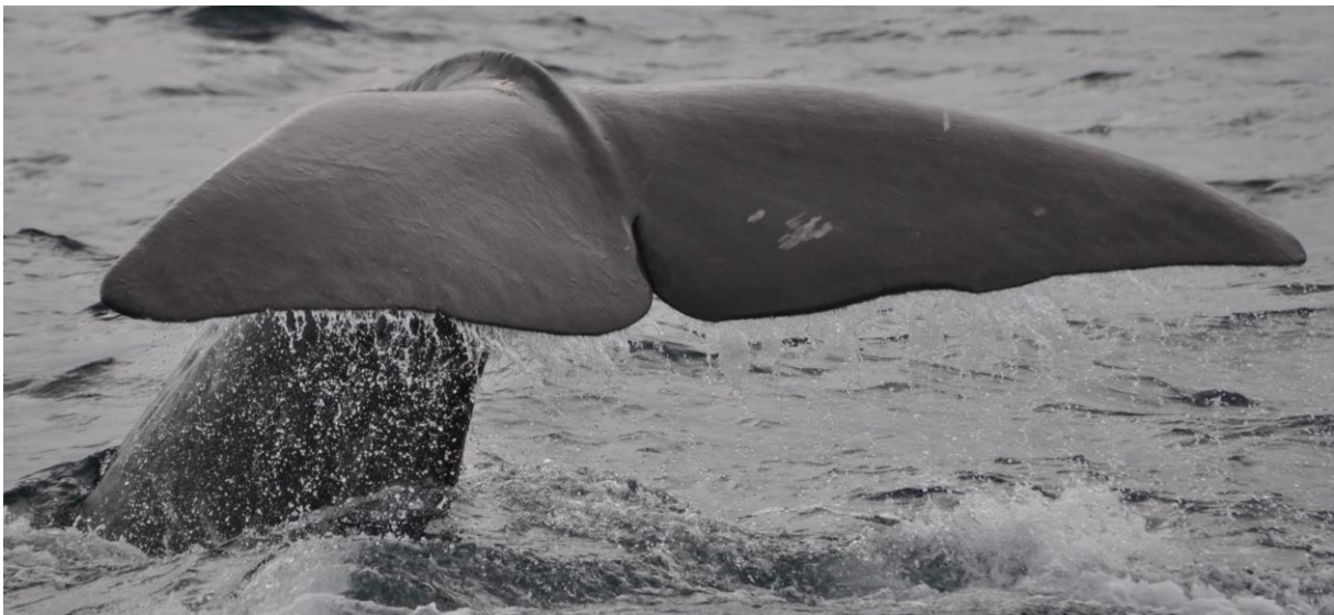
Fluke eines abtauchenden Pottwals, Foto: Jörg Petersen auf Pixabay

Eine gelungene Verknüpfung von nachhaltigem Whale Watching und Forschung zeigt auch die Arbeit der Stiftung firmm 10 , die Ausfahrten zu den Walen und Delfinen in der Straße von Gibraltar durchführt. Zum Team gehören Biologen, die verschiedene Forschungen zu den in der Straße von Gibraltar vorkommenden Meeressäugern betreiben. So konnte dank Auswertung der Sichtungsdaten beispielsweise eine neue Fährlinie zwischen Europa und Afrika verhindert werden, die mitten durch ein Grindwalgebiet geführt hätte. In der Meerenge leben auch Pottwale, die beim Abtauchen regelmäßig ihre Fluke zeigen.