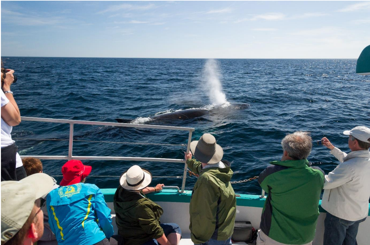
Ein auftauchender Finnwal vor der Küste Kanadas wird von Touristen bestaunt

Beschäftigt man sich mit dem Forschungsstand zum Thema Whale Watching, wird schnell deutlich, warum es so wichtig ist, einen Anbieter zu wählen, der eine sanfte und respektvolle Begegnung mit den Meeressäugern ermöglicht. Unbestritten ist, was zahlreiche Untersuchungen zeigen: Die Beobachtung von Delfinen und Walen in ihrem Lebensraum bleibt nicht ohne Auswirkungen auf die Tiere!